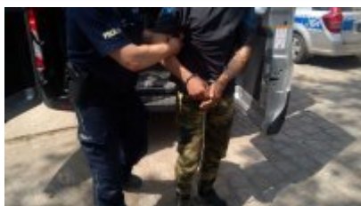
Podjezrani o rozboj aresztowani

Drugiego z mężczyzn - 27-letniego mieszkańca Brzegu - kryminalni zatrzymali już następnego dnia. Obaj mężczyźni usłyszeli zarzut rozbój. Sąd tymczasowo aresztował ich na 3 miesiące. Zatrzymanym grozi teraz do 12 lat więzienia.