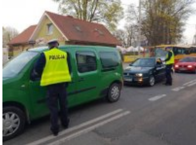
Trzeźwy poranek w Nysie