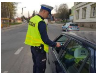
Trzeźwy poranek w Nysie

Stan po użyciu alkoholu zachodzi, gdy zawartość alkoholu w organizmie wynosi lub prowadzi do stężenia we krwi od 0,2‰ do 0,5‰ alkoholu albo obecności w wydychanym powietrzu od 0,1 mg do 0,25 mg alkoholu w 1 dm 3 . Stan, w którym zawartość alkoholu we krwi wynosi powyżej 0,5 ‰ albo 0,25 mg na dm 3 wydychanego powietrza - jest określany zgodnie z art. 115 §16 k.k. stanem nietrzeźwości.